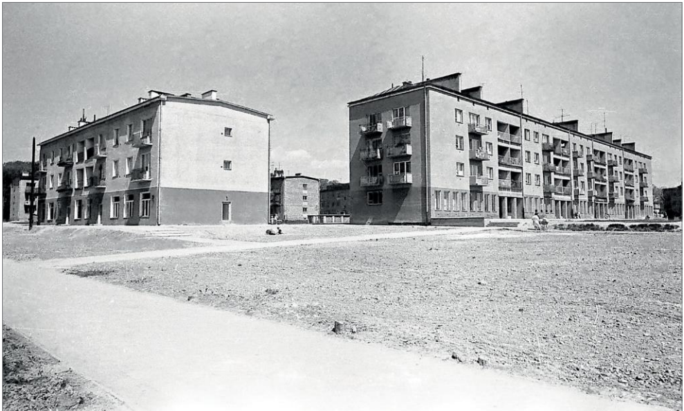
Ryc. 4. Osiedle Planty od południowego zachodu (ul. Piłsudskiego).