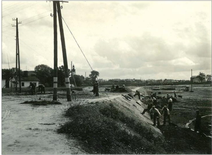
Ryc. 1. Budowa drogi do projektowanej Fabryki Polskiego Monopoli Tytoniowego – dzisiejszej ul. Męczenników Rotundy (skrzyżowanie z ul. Szczepreską)