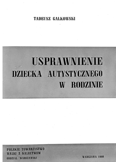
Ilustracja 1. Okładka książki Tadeusza Gałkowskiego pt. Usprawnienie dziecka autystycznego w rodzinie.

W przedwstępie książki Zarząd Oddziału Warszawskiego Polskiego Towarzystwa Walki z Kalectwem napisał: