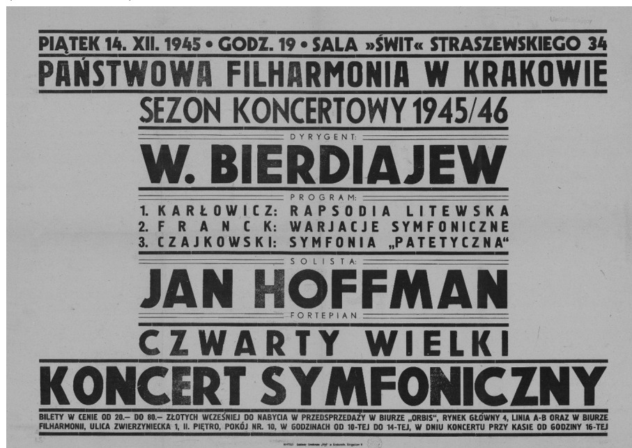
Magazyn Druków Ulotnych Biblioteki Narodowej w Warszawie, sygn. Dżs XIXA 5.

Polski: im. Roberta Schumanna w Berlinie (1956), w Pradze (1957), im. Ferruccio Busoniego w Bolzano (1958), im. Giovanniego Battisty Viottiego w Vercelli (1961, 1962), w Monachium (1966, 1968, 1970, 1972, 1975). W latach 1962–1981, każdego roku latem, prowadził w Helsinkach mistrzowskie kursy dla pianistów fińskich (Akademia im. J. Sibeliusa), a w latach 1977–1978 kursy pianistyczne w Weimarze w Niemczech. Był także członkiem gremiów jurorskich w konkursach organizowanych w Polsce (m.in. dla polskich kandydatów na międzynarodowe konkursy im. Fryderyka Chopina w Warszawie). Współorganizował również słynne spotkania muzyczne w Baranowie Sandomierskim (1976–1981) i festiwal Młodzi Muzycy Młodemu Miastu w Stalowej Woli (1975–1979).