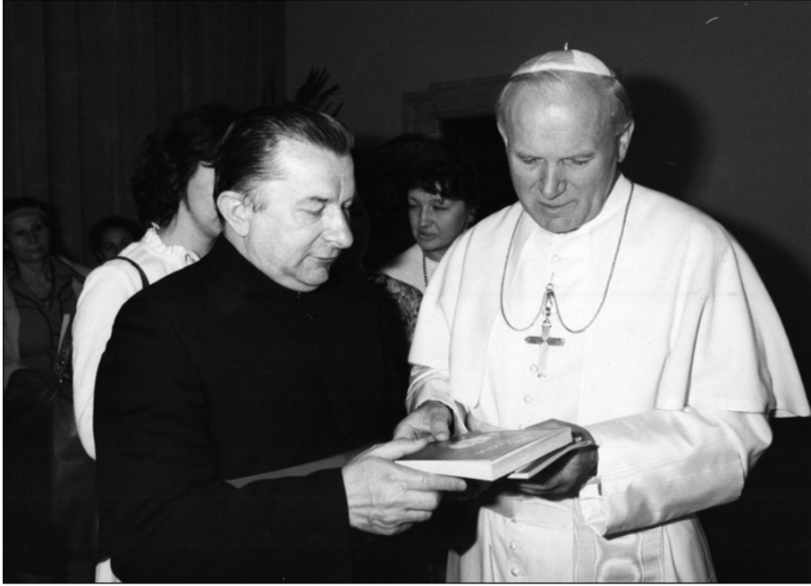
Fotografia 4. Prezentacja Janowi Pawłowi II pierwszego wydania kazań ks. Jerzego Popiełuszki w 1985 r. na Watykanie.