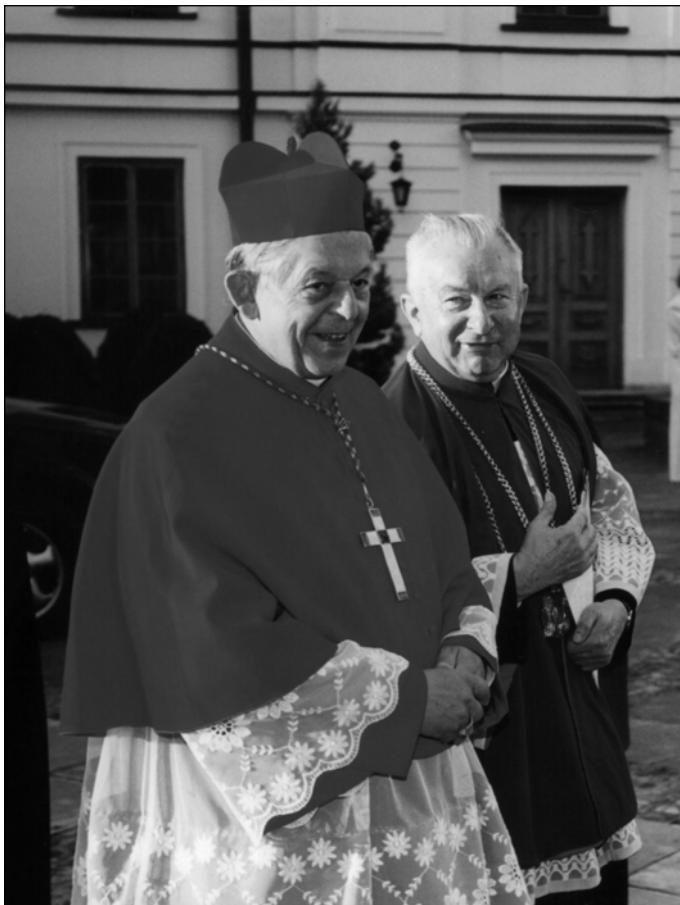
Fotografia 6. Z prymasem Józefem Glempem w czasie Dni Wilanowa 12 września 2004 r.