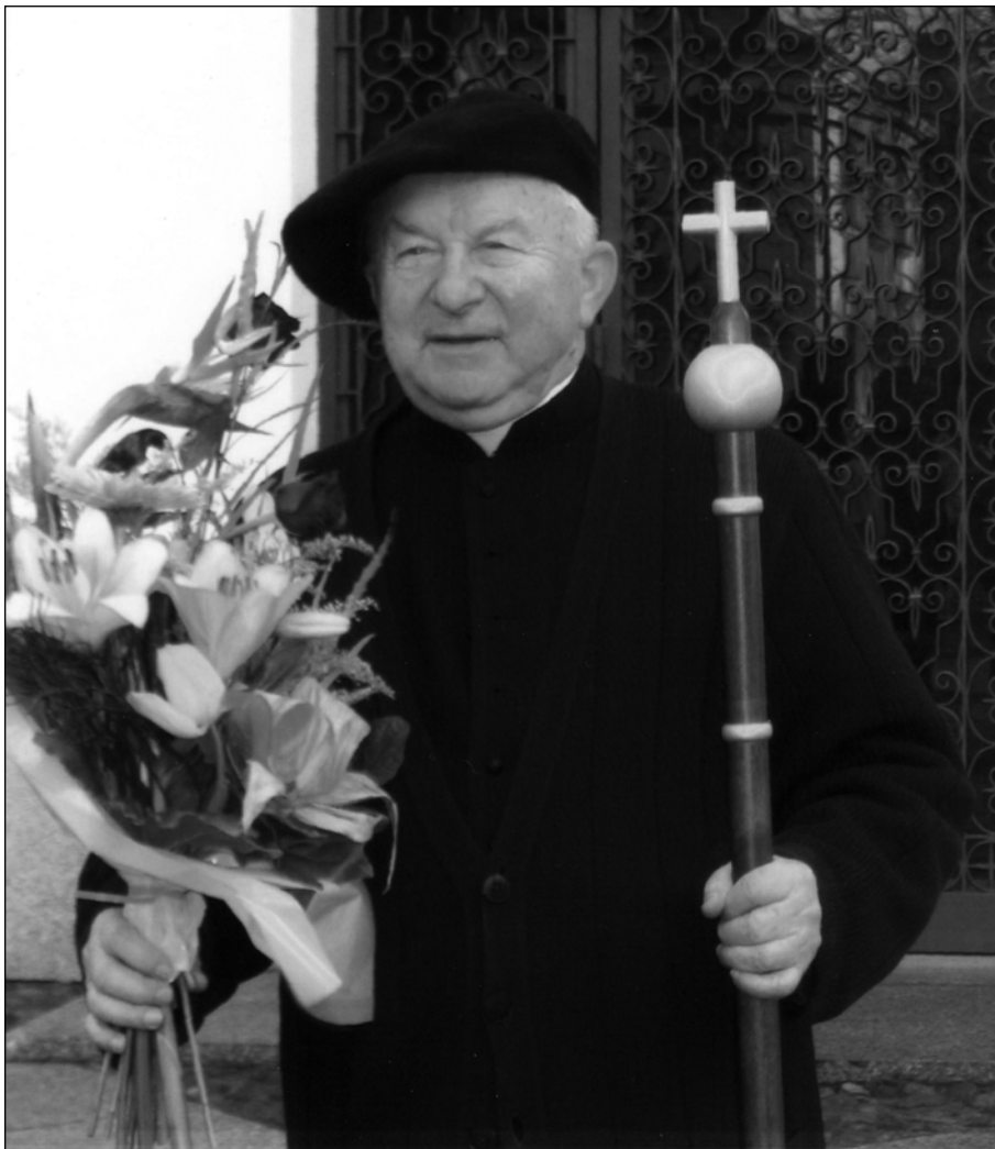
Fotografia 7. Podczas jubileuszu 50-lecia kapłaństwa przed Dzwonnicy Trzeciego Tysiąclecia w Wilanowie w 2006 r.