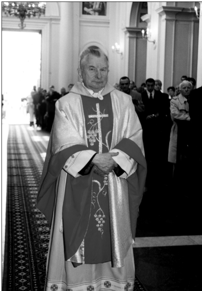
Fotografia 5. W kościele Św. Anny w Wilanowie w 2001 r.