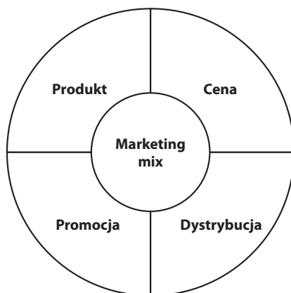
Rys. 2. Marketing mix — koncepcja 4P