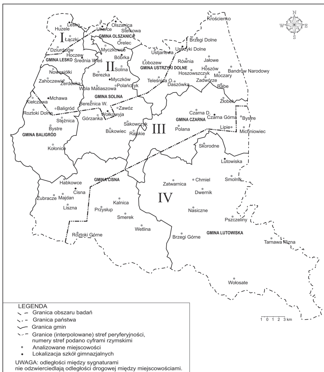
Rys. 1. Strefy peryferyjności na obszarze badań

W celu określenia związku pomiędzy siłą więzi terytorialnych młodzieży a peryferyjnością zamieszkiwanego przez nią obszaru, wyznaczono na obszarze badań 4 strefy o różnym stopniu peryferyjności. Za kryterium przyjęto rzeczywistą odległość drogową względem kluczowego ośrodka regionu, za jaki uznano Sanok. Za wartość graniczną przyjęto odległość 20 km. Strefa o najniższym stopniu peryferyjności, to strefa I. Obejmuje ona miejscowości położone w odległości drogowej do 20,0 km od Sanoka, a trzy pozostałe odpowiednio: 20,1–40,0 km, 40,1–60,0 km oraz powyżej 60,0 km (rys. 1). Zaznaczyć należy, że ze względu na górzystość terenu rzeczywiste odległości drogowe są na ogół niezgodne z prostoliniowymi odległościami na mapie.