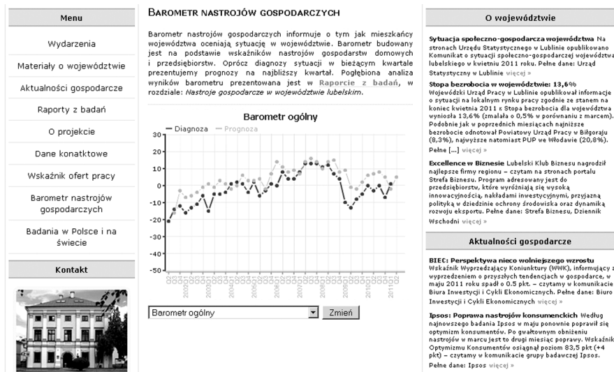
Rys. 2. Prezentacja wyników „Barometru Nastrojów Gospodarczych”

Do dyspozycji osób odwiedzających stronę internetową projektu dostępne są również aktualności gospodarcze z kraju i materiały o województwie. Znajdujące się tutaj informacje to przegląd najistotniejszych wiadomości gospodarczych publikowanych m.in. przez prasę codzienną, urzędy statystyczne, urzędy pracy i inne instytucje zajmujące się badaniem stanu gospodarki. Koniunktura konsumencka, perspektywy rynku pracy, sytuacja społeczno-gospodarcza województwa i rankingi największych przedsiębiorstw to tylko niektóre z zagadnień, które można znaleźć na internetowym portalu informacyjnym projektu. Na bieżąco publikowane są tu informacje o komunikatach Głównego Urzędu Statystycznego oraz wynikach badań koniunktury i nastrojów gospodarczych w Polsce prowadzonych przez Biuro Inwestycji i Cykli Ekonomicznych (BIEC) oraz Instytut Rozwoju Gospodarczego Szkoły Głównej Handlowej w Warszawie. Ważne miejsce na stronie projektu zajmują również publikowane przez Komisję Europejską badania nastrojów gospodarczych (Economic Sentiment Indicator). Obecnie internetowy portal informacyjny projektu zawiera kilkaset wiadomości dotyczących sytuacji gospodarczej zarówno woj. lubelskiego, jak i kraju.