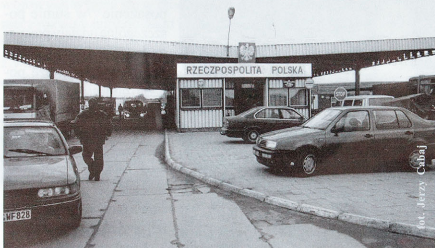
Granica w Hrebennem to handlowa brama na Ukrainę

zajmuje powierzchnię 6,3 ha. Położony jest w północno-wschodniej części Chełma, w odległości 100 metrów od międzynarodowej trasy drogowej S-12 Warszawa-Chełm-Dorohusk-Kijów i 200 m od węzła kolejowego przy szlaku Berlin-Warszawa-Kijów. Wydzielony obszar zgodnie z planem zagospodarowania przestrzennego, przeznaczony jest pod przemysł, składy, usługi. Teren jest częściowo zabudowany oraz posiada uzbrojenie techniczne.