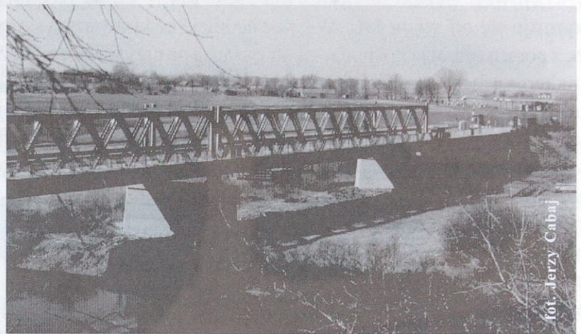
Most na Bugu (Zosin-Ustulug)

Mamy ogromną nadzieję, że wszystkie lokalne inicjatywy służące rozwojowi danych terenów będą coraz mocniej wspierane przez wojewódzkie władze samorządowe i administracyjne. Warto, bo jest szansa, że lokalna gospodarka nabierze wiatru w żagle. Mamy również nadzieje, że strategia gospodarcza województwa będzie jedena, rozwojowa, wieloletnia, tworzona ponad podziałami politycznymi.