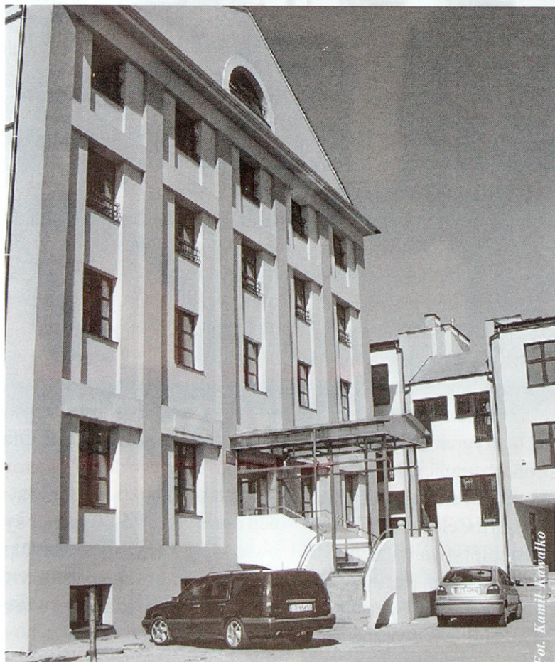
COLLEGIUM NOVUM WSZiA w Zamościu

Drugim profilem działalności gospodarczej w projektowanym Zespole Przedsiębiorczości byłaby produkcja różnego rodzaju linii