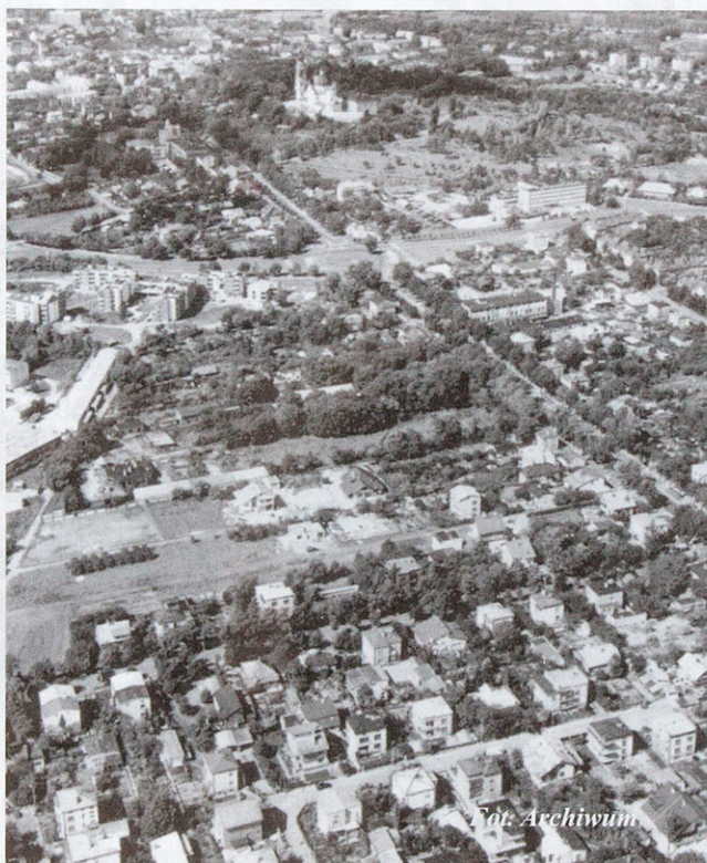
Chełm - tu utworzono pierwszy w regionie zamiejscowy obszar SSE

Zezwolenie na prowadzenie działalności gospodarczej na terenie strefy określa ściśle: przedmiot działalności według Polskiej Klasyfikacji Wyrobów i Usług; wysokość