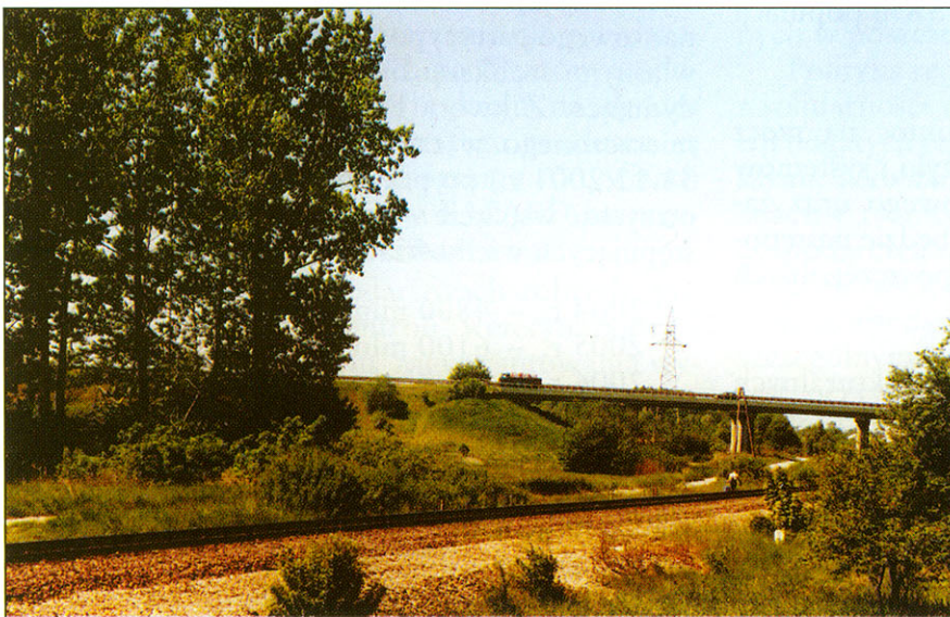
Wiadukt w Sitańcu. Stąd będzie zjazd na obwodnicę wokół Zamościa.

Projektowana droga będzie klasy GP, tj. droga główna, ruchu przyspieszonego, czasowo z jedną jezdnią – dwa pasy ruchu; szerokość jezdni 7 m; pobocza