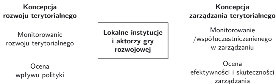
Rys. 1. Najważniejsze elementy współczesnego paradygmatu rozwoju (tj. zintegrowanego podejścia do kształtowania rozwoju)

Biorąc powyższe pod uwagę można powiedzieć, że w nowym paradygmacie terytorialnej polityki rozwoju — zbieżnym z koncepcją rozwoju lokalnego — oraz w koncepcji zarządzania terytorialnego szczególną rolę w procesie rozwoju przypisuje się szeroko rozumianej współpracy samorządów z lokalnymi aktorami, w tym organizacjami pozarządowymi (rys. 1). Ten ostatni rodzaj współpracy jest przedmiotem badań w niniejszym artykule.