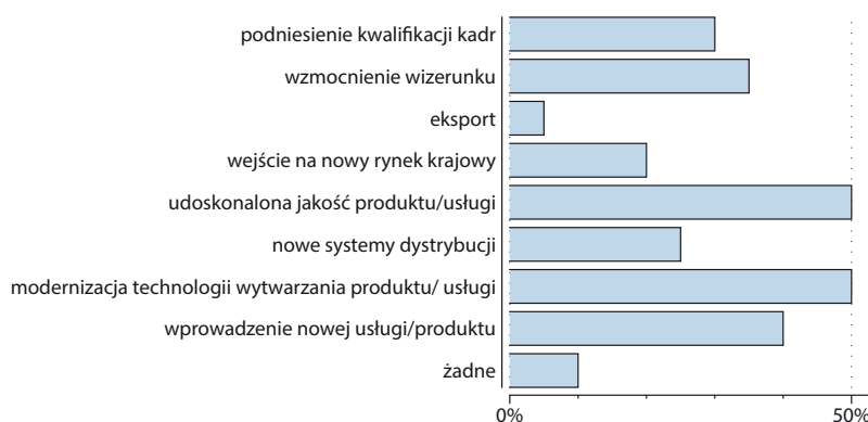
Rys. 1. Zrealizowane przedsięwzięcia rozwojowe w ostatnich trzech latach

Zgodnie ze Strategią Lizbońską, rozwój przedsiębiorstw w kraju oraz ekspansja na rynki zewnętrzne następować ma przez działalność badawczo-rozwojową i innowacje. W praktyce oznacza to skoncentrowanie się na kwestiach jakości produktów i promowaniu partnerstw (Strużycki 2004, s. 19). Zasadniczym celem wprowadzania innowacji jest wzmacnianie lub zachowanie pozycji konkurencyjnej. Charakter aktywności innowacyjnej przedsiębiorstw zależy od ich potencjału innowacyjnego (Zastempowski 2008, s. 133). Wprowadzenie innowacji determinowane jest m.in. przez potencjał techniczny i infrastrukturalny, dostępność źródeł finansowania oraz twórcze przetwarzanie wiedzy i informacji (Zrobek 2008, s. 192). Połowa badanych przedsiębiorstw w latach 2012–2014 przeprowadziła modernizację technologii wytwarzania produktu/usługi oraz udoskonaliła ich jakość. 40% wprowadziło nowe produkty lub usługi, a 35% koncentrowało się na wzmocnieniu wizerunku i podniesieniu kwalifikacji kadr (30%).