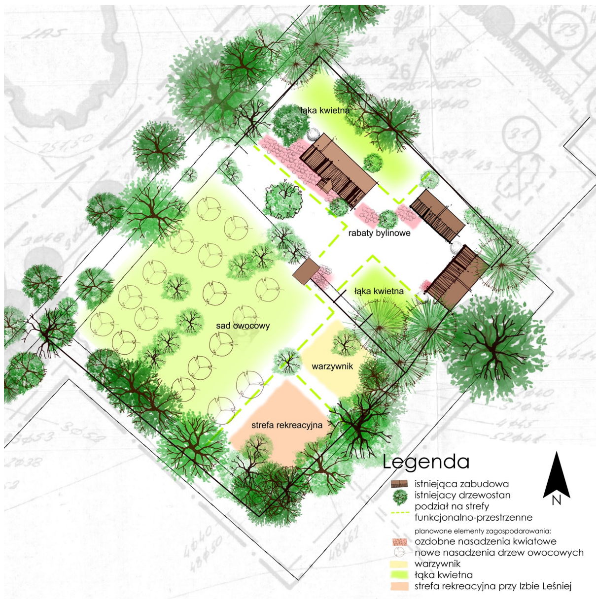
Rys. 4. Rzut koncepcji projektowej zagospodarowania terenu przy Izbie Leśnej we Floriance. Opracowanie graficzne J. Myśliwiec

Projekt zagospodarowania terenu przy Izbie Leśnej we Floriance jest próbą odtworzenia wiejskiego ogrodu. W wyniku analiz kartograficznych i literatury tematu stworzono koncepcję projektową, która opiera się na tradycji miejsca. W projekcie zaproponowano stworzenie rabat kwiatowych, które będą atrakcyjne przez cały okres wegetacyjny. Zastosowano kontrastowe połączenia barw. Rabaty usytuowano wzdłuż drogi prowadzącej do budynku Izby oraz w najbliższym jej sąsiedztwie. Kształty rabat wpisane są w proste formy. Dobór gatunkowy opiera się na typowych dla tradycyjnych ogrodów wiejskich bylinach takich jak liliowce, kosańce, piwonie, ostróżki, maki, hübiny czy floksy. Rabaty bylinowe uzupełniono szparagiem oraz roślinami jednorocznymi, wśród których znalazły się m.in. cynie, kosmosy, nagietki, groszek pachnący i maciejka. W ogrodzie przy Izbie Leśnej we Floriance zaproponowano także rośliny dwuletnie, takie jak dziewanna, prawoślaz różowy, stokrotka, niezapominajka oraz miesięcznica. W najbliższym sąsiedztwie budynku zaprojektowano rośliny pachnące oraz zioła.