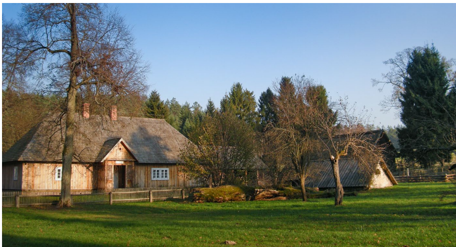
Rys. 3. Widok na zabudowania przy Izbie Leśnej — stan obecny (2014).

przyrodniczego Florianki, jej historii, kultury, obyczajów i obrzędów. Budynkowi starej gajówki, towarzyszy tradycyjna zabudowa charakterystyczna dla zagród wiejskich: stodoła, szopa i piwnica (rys. 3). Siedlisko zajmuje obszar o powierzchni blisko 65 arów i jest ogrodzone niskim, drewnianym płotem. Podwórze gospodarskie porośnięte jest murawą. Na terenie wydzielonym wewnętrznym płotkiem, znajdują się: niewielki warzywnik, miejsce rekreacyjne z paleniskiem oraz pozostałość starego sadu założonego na planie kwadratu.