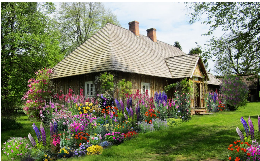
Rys. 5. Wizualizacja koncepcji projektowej zagospodarowania terenu przy Izbie Leśnej we Floriance. Opracowanie graficzne J. Myśliwiec

W projekcie znalazła się także przestrzeń sprzyjającą wypoczynkowi i rekreacji, gdzie zaplanowano palenisko oraz drewniany stół i siedziska w prostej formie. Sposoby użytkowania terenu przy Izbie Leśnej we Floriance podzieliły całość projektowanej przestrzeni na poszczególne kwatery, które oddzielone są w projekcie niskimi płotkami drewnianymi lub obwódkami z bukszpanu. Uzupełnienie całości projektowanej kompozycji ogrodowej we Floriance będą stanowiły nasadzenia krzewów ozdobnych takich jak jaśminowiec wonny, bez lilak, dzika róża, czarna bez i kalina koralowa, które są typowymi gatunkami dla ogrodów wiejskich.