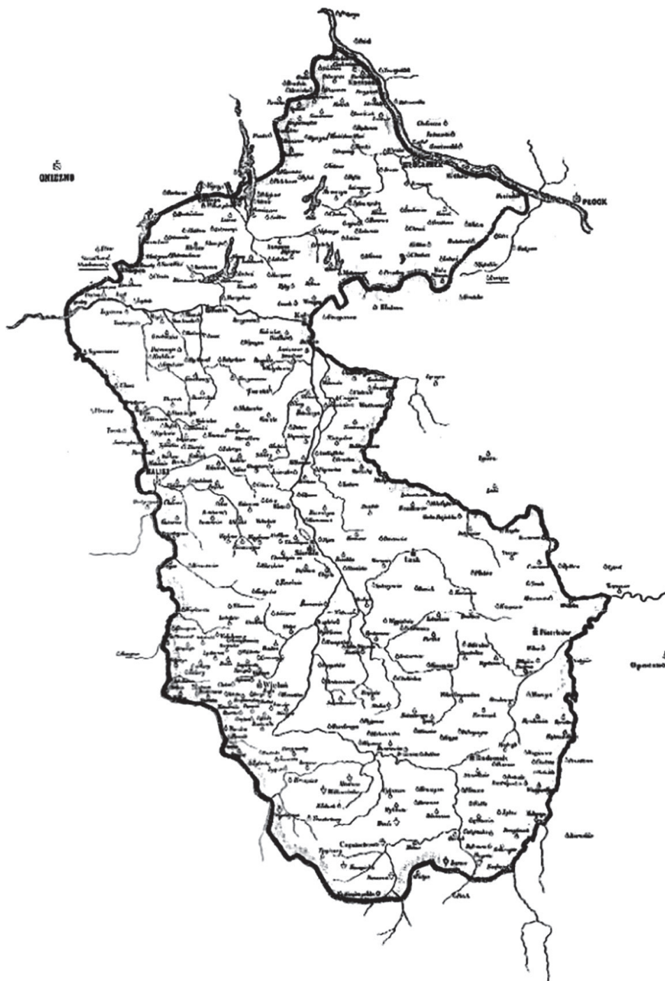
Mapa diecezji kujawsko-kaliskiej (1818–1925)