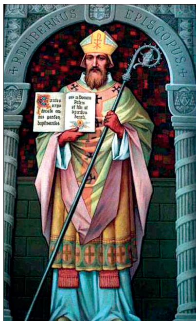
Reinbern – pierwszy biskup kołobrzegi

pogańskich. W latach 1007–1013 Pomorze Zachodnie oderwało się od Polski, a więc w okresie, kiedy Bolesław Chrobry prowadził wojnę z cesarzem Henrykiem II; zdobył Łużyce i Miłsko. Oddziały polskie zmuszone zostały jednak odejść z Pomorza w rejon toczących się walk. Kołobrzeg musiał opuścić też biskup Reinbern 18 .