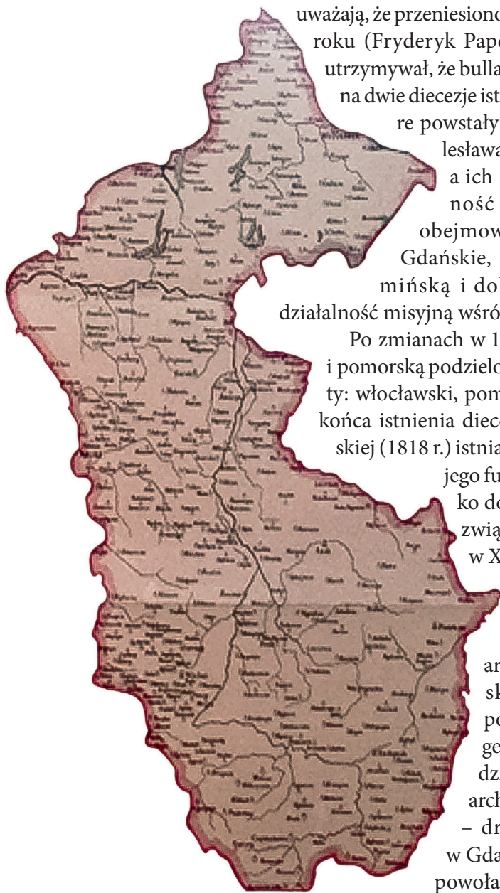
Mapa diecezji kujawskiej i pomorskiej (z 1890 r.)