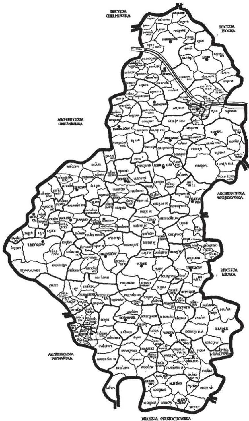
Mapa diecezji włocławskiej (1925–1992)