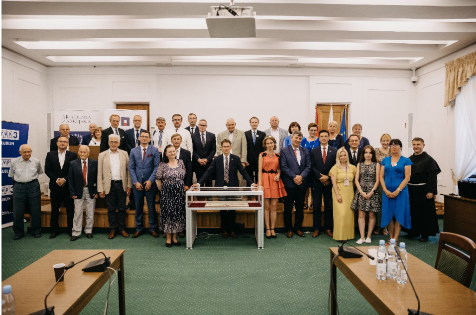
Il. 4. Wspólna fotografia na zakończenie konferencji.