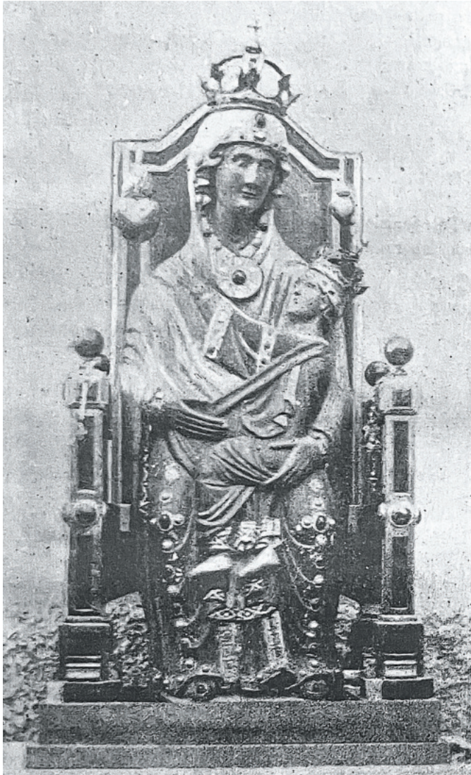
Il. 2. Statua Matki Bożej Mentorelskiej. Fotografia sprzed 1901 roku.