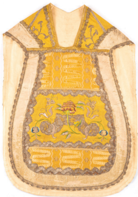
Il. 8. Ornat uszyty z sukienki ofiarowanej figurze Matki Bożej Łaskawej przez cesarżową Marię Teresę (przód). Sanktuarium Matki Bożej Łaskawej na Mentorelli.

Dziś w sanktuarium na Mentorelli zachowało się jedynie kilka historycznych szat liturgicznych. Jedna z nich prezentuje się szczególnie okazale: to ornat o wymiarach 104×73 cm, wykonany z trzech rodzajów tkanin, zachowujący krój typowy dla ornatów szytych w końcu XIX wieku, jednak skomponowany odmiennie: brakuje tradycyjnego podziału na kolumnę i boki, szytych zazwyczaj z różnych tkanin bądź przynajmniej wyróżnionych taśmami czy koronką (il. 8, 9).