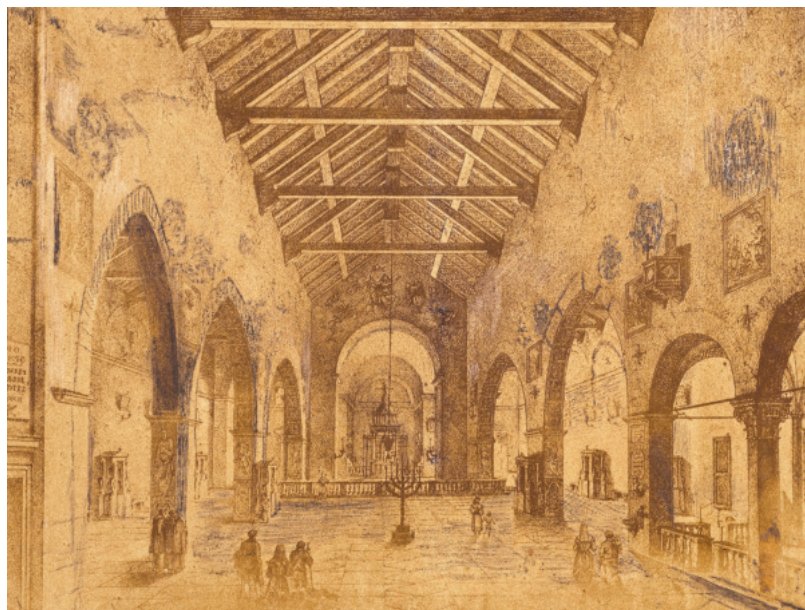
Il. 5. Wnętrze sanktuarium. Rycina w zbiorach sanktuarium Matki Bożej Łaskawej na Mentorelli.