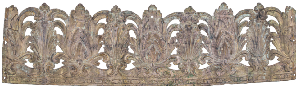
Il. 11. Korona na figurę Matki Bożej. Sanktuarium Matki Bożej Łaskawej na Mentorelli.

Analiza ryciny Mochettiego pozwala łączyć przedstawioną na nim sukienkę figury z ornatem przechowywanym w klasztorze mentorelskim. Nie ulega wątpliwości, że właśnie z szaty Madonny uszyto tył ornatu. Wskazuje na to duży kwiat peonii w projekcji bocznej, ukazany w dolnej części zarówno ornatu, jak i sukni Madonny, oraz pęk stylizowanych liści akantu, z którego wyrastają dwie cienkie, giętkie gałązki poprowadzone symetrycznie na boki, zakończone parą kwiatów lilii z charakterystycznymi długimi pręcikami. Różnice w prowadzeniu koronkowej wstęgi mogą być wynikiem przeróbek, jakich dokonano przy szyciu ornatu, ale mogą też stanowić inwencję rysownika – twarze Maryi i Jezusa także odbiegają od oryginału, są wyraźnie idealizowane, „poprawione”. W analogiczny sposób (z pewnymi zmianami w stosunku do oryginału) zostały oddane na grafice Mochettiego korony spoczywające na skroniach Madonny i Jezusa. W sanktuarium na Mentorelli przechowywane są one do dziś, a zdjęto je z figur zapewne przed koronacją papieskimi koronami w 1901 roku (il. 11).