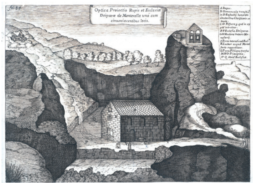
Il. 4. Widok skały i kościoła na Mentorelli. Ilustracja w: A. Kircher, Historia Eustachio-Mariana , Rzym, biblioteka klasztoru księży zmartwychwstańców.