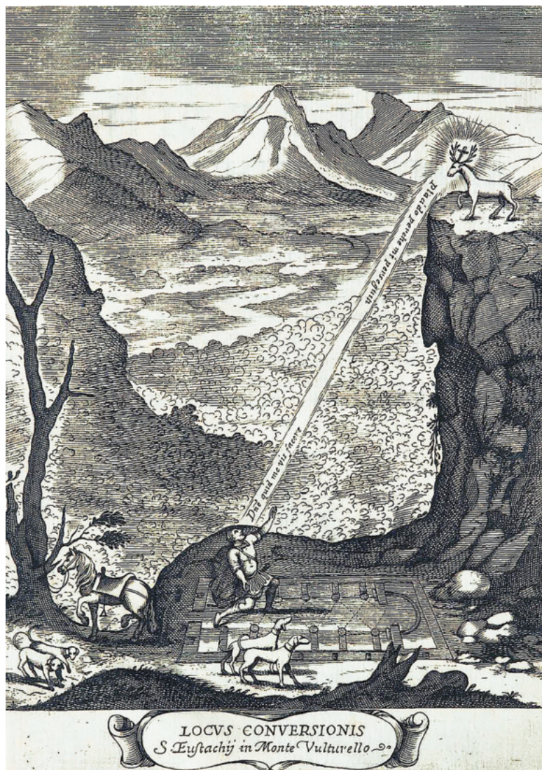
Il. 3. Nawrócenie św. Eustachego. Frontysepis dzieła A. Kirchera, Historia Eustachio-Mariana , Rzym 1665, biblioteka klasztoru księży zmartwychwstańców.