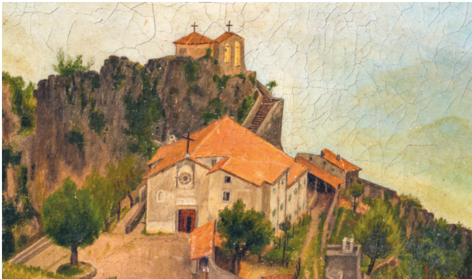
Il. 7. E.C., Sanktuarium na Mentorelli , 1881, olej na płótnie. Obraz w zbiorach sanktuarium Matki Bożej Łaskawej na Mentorelli.

Ojcowie zmartwychwstańcy rozpoczęli swoją działalność na Mentorelli od gruntownego remontu zabudowań (il. 7). Na nowo zaaranżowali również ołtarz główny z wystawionym w nim posągiem Matki Bożej Łaskawej 24 . Z figury Matki Bożej zdjęto wówczas sukienkę, jednak ze względu na osobę fundatorki zachowano cenną materię i skomponowano z jej fragmentów ornaty 25 .