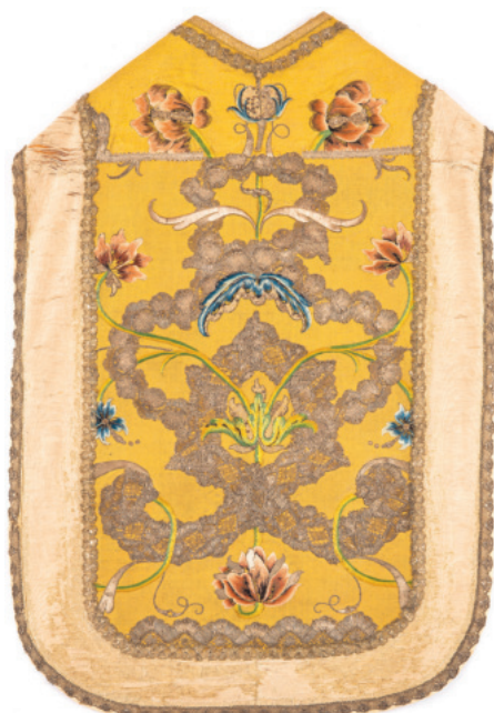
Il. 9. Ornat uszyty z sukienki ofiarowanej figurze Matki Bożej Łaskawej przez cesarżową Marię Teresę (tył). Sanktuarium Matki Bożej Łaskawej na Mentorelli.